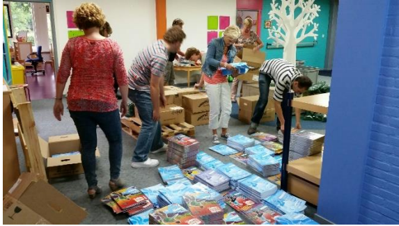
Team pakt nieuwe rekenmethode uit: controleren en uitzoeken

Ook in groep 1-2 gaan we werken met een andere methode: 'Kleuterplein'. In deze methode staat een thema centraal, dat gekoppeld is aan de lessen die in de groep gegeven worden. Kleuterplein is moderner dan onze vorige methode en heeft oefensoftware voor de kinderen en instructiesoftware voor de leerkrachten. De digitale instructies vinden plaats in het lege lokaal d.m.v. het Smartboard.