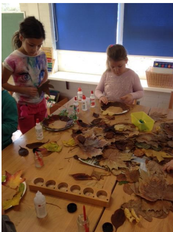
Tot de volgende keer. De kleuterbouw.

Genoten hebben we van ons allereerste knutselcircuit. Vind je het leuk om ook een keertje te komen helpen; de intekenlijsten hangen bij de deur.